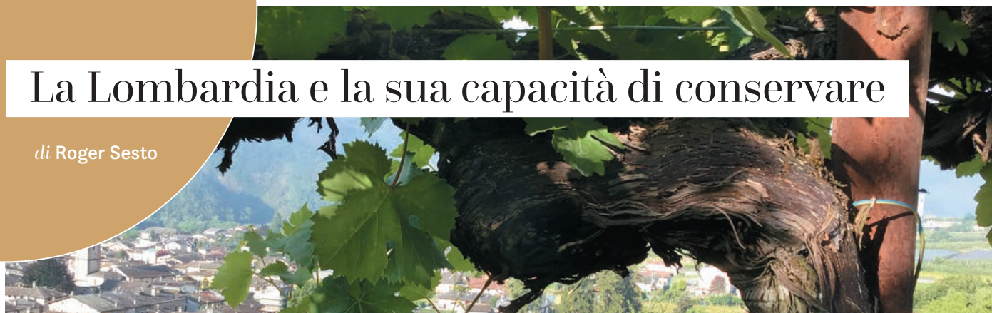
▲ Ceppo antico di Chiavennasca e sullo sfondo Chiuro (Sondrio), dove ha sede Nino Negri

L'industriosa Lombardia presenta delle aree vitivinicole d'eccellenza, ove dimorano vere chicche in materia di vecchie viti. Ciò a partire dalla Valtellina , grazie alla sua storia agricola millenaria e ai suoi 2.500 km di muretti con 30 gradi di pendenza; segue l' Oltrepò . Più sorprendente scoprire che anche in Franciacorta insistono vigneti assai vetusti. Un prezioso patrimonio: i ceppi più longevi sanno adeguarsi meglio alle sempre più frequenti bizzesse meteorologiche; inoltre, grazie al loro profondo apparato radicale, attingono un nutrimento di assoluta nobiltà.