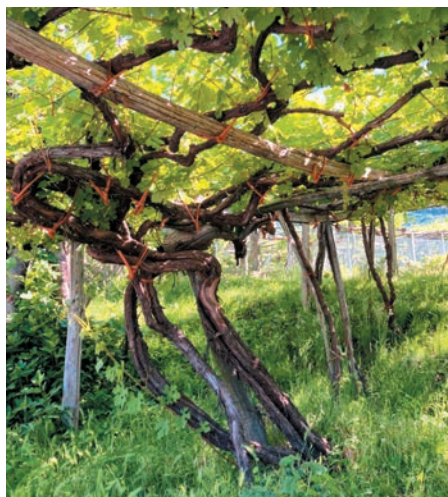
L'età media delle pergole di Prunent (Nebbiolo) in Val d'Ossola è 70-80 anni

Delle 55.000 bottiglie prodotte, interamente provenienti dai 14 ettari di proprietà, solo una decina di migliaia provengono dai tre famosi cru della famiglia Antoniolo. Osso San Grato è il più grande, con i suoi 5 ettari totalmente esposti a sud su terreno ricco di porfido e di origine vulcanica interamente piantato a Nebbiolo con ceppi di circa 60 anni di età. Un vigneto ripido dal quale si produce uno dei più grandi Gattinara. Vinificato in cemento, con alcolica e malolattica spontanee, poi 3 anni di affinamento in botte. All'eleganza dei vini dell'Alto Piemonte si aggiungono una bella concentrazione e una struttura di grande longevità.