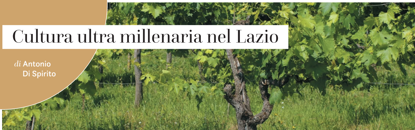
▲ La vigna di oltre 80 anni del Cabernet Atina Riserva di Cominium è coltivata a palmetta (alberello a filare)

Nella regione Lazio la viticoltura è ultra millenaria; in alcune macro aree è facile trovare vigneti che hanno ben oltre i 50 anni di età: come Atina , Cesanese del Piglio , Olevano Romano e in Alta Tuscia . In Bassa Ciociaria la denominazione Cabernet Atina Doc, istituita nel 1999, utilizza vitigni bordolesi dal 1867 per volontà della famiglia Visocchi.