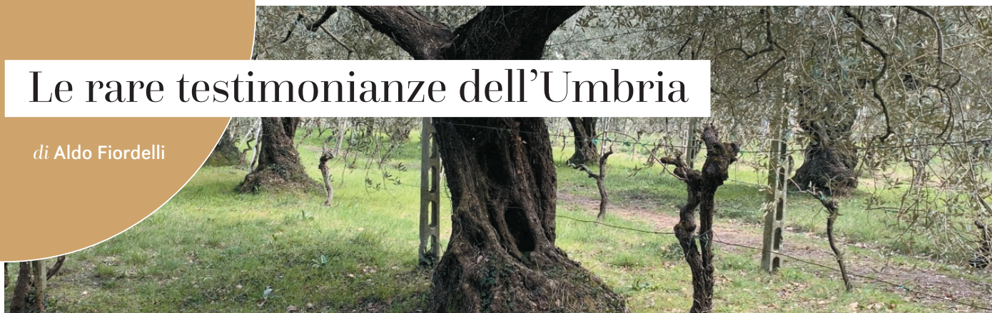
▲ Le viti maritate di Cantina Zanchi, ad Amelia (Terni); un'usanza tipica e arcaica che qui resiste ancora oggi