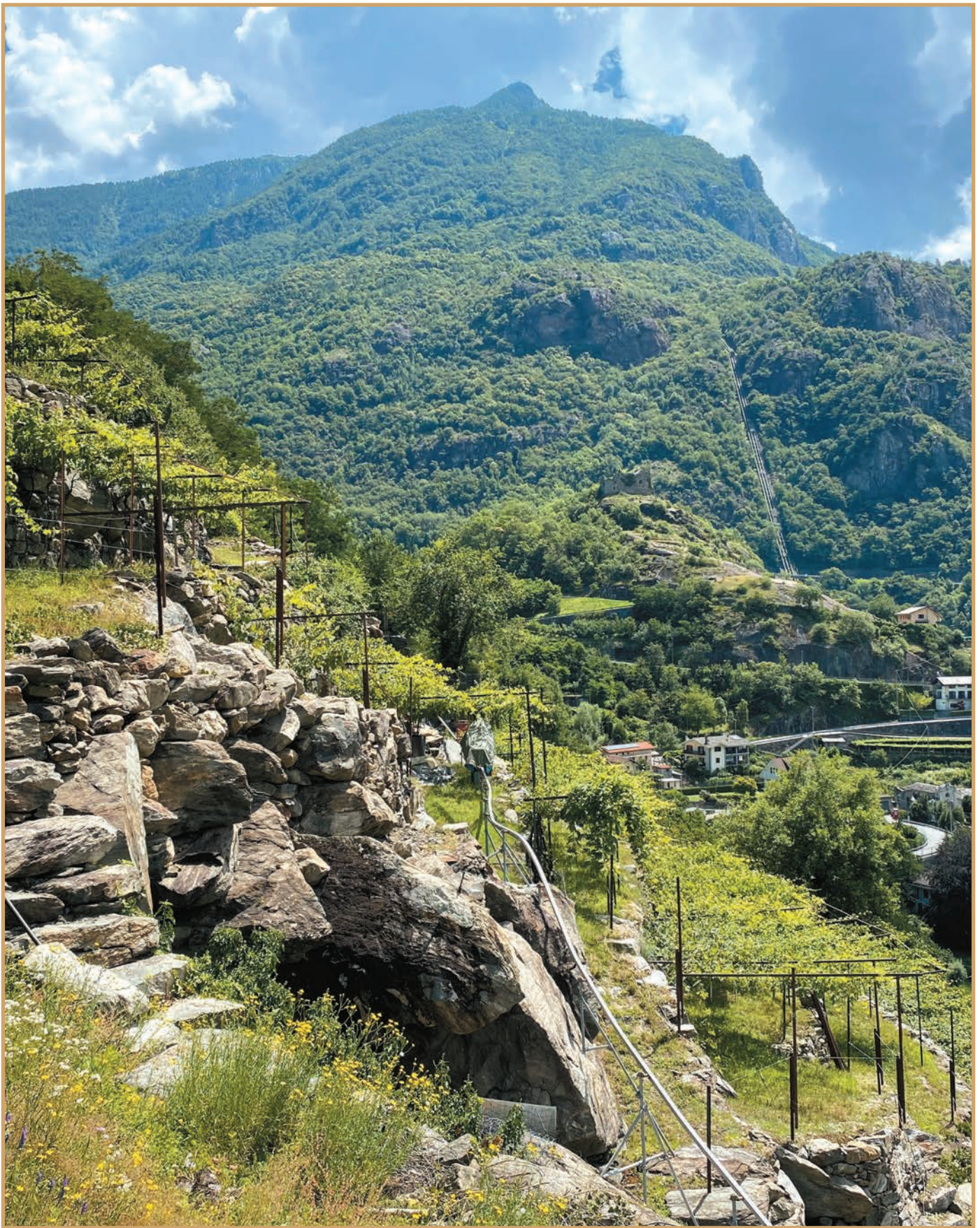
Spesso la vite è allevata su terrazze con muretti a secco incastonati tra le rocce: qui si lavora solo con l'ausilio della monorotaia