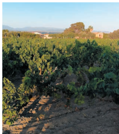
L'antico vigneto di Carignano di Cantina Xabarra è a piede franco su suoli sabbiosi