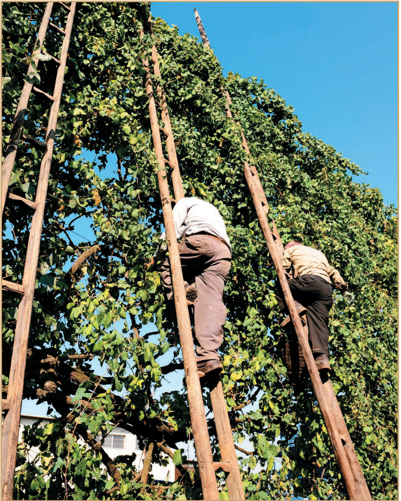
Le viti ad alberata (maritate) si estendono da un pioppo all'altro, arrivando a superare i 10 m di altezza e ricoprendo come un muro di rami, foglie e grappoli la distanza che separa gli alberi a cui sono appese