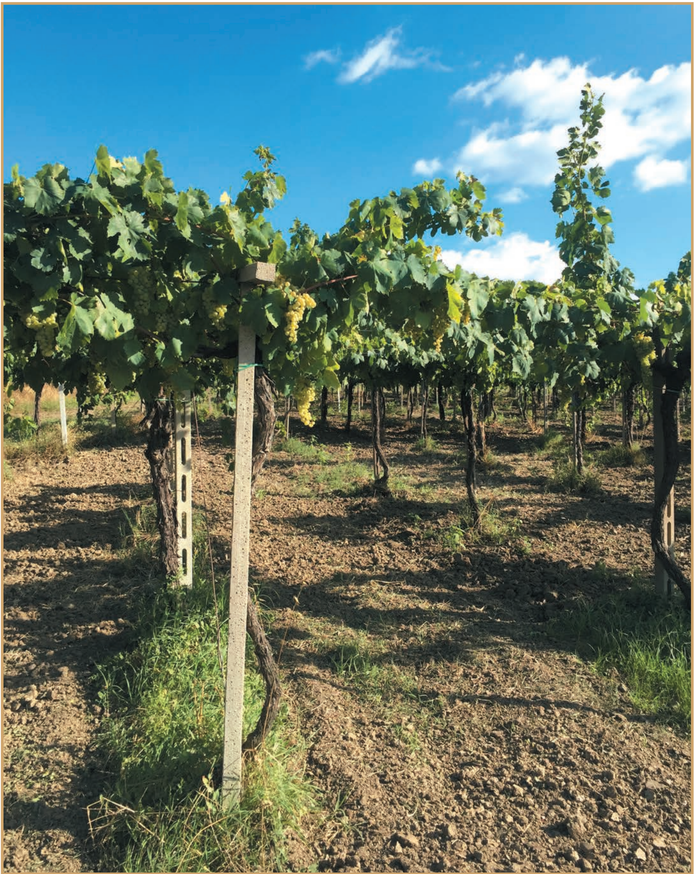
La maggior parte dei vigneti più vecchi d'Abruzzo si trova nell'area centro-settentrionale © Valentini, Loreto Aprutino (Pescara)